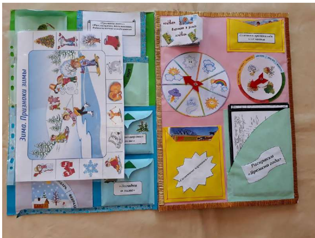
Содержание лэпбука (продолжение)