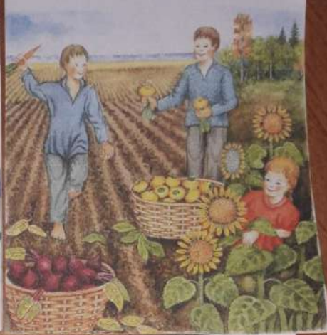
Расскажи, что изображено на картинке летом?