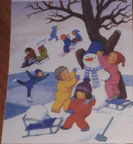
Расскажи, что изображено на картинке зимой?