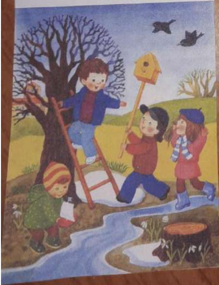
Расскажи, что изображено на картинке весной?