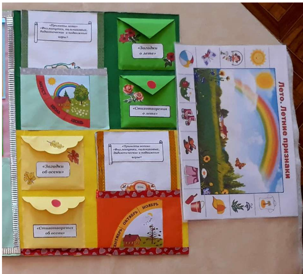
Содержание лэбука (продолжение)